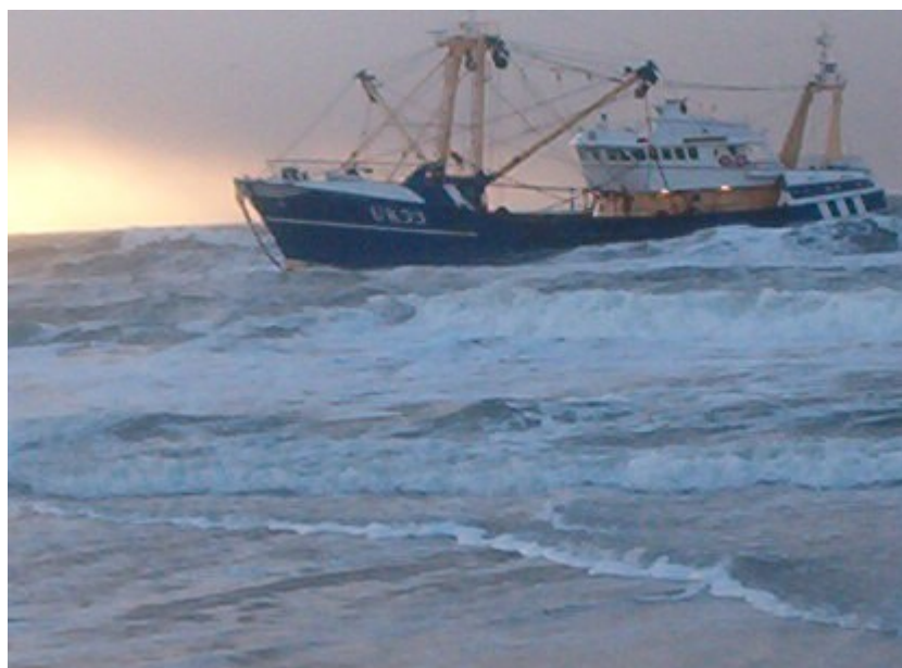
De Urk 33 ligt bij den Hoorn op het strand en lijkt reddeloos verloren.