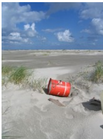
Een van de aangetroffen vaten

Rijkswaterstaat en gemeente zijn momenteel in spoedzitting bijeen in een calamiteitenteam om oplossingen te vinden voor het ruimen van het gif.