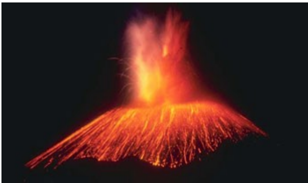
De gloeiende berg

Na onderzoek blijkt dat het Doolhof de kratermond was van een eeuwenoude vulkaan, die al tienduizenden jaren sliep. Men