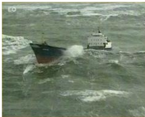
Poolse vrachtvaarder 'Aurora'

Bij Paal 17 is gisteren een enorme hoeveelheid gif aangespoeld. De herkomst is onduidelijk, het vermoeden is een in problemen geraakt Poolse vrachtvaarder eerder deze week.